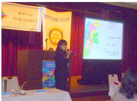
卓話 吉川千登勢 君